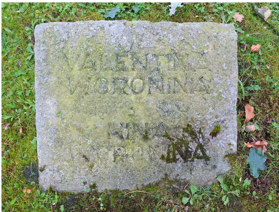
Mescheder Waldfriedhof („Franzosenfriedhof“), September 2017