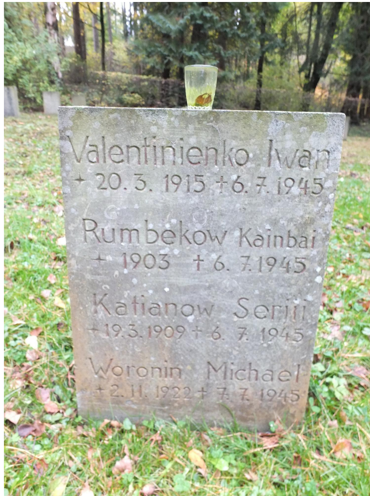
„Russischer Ehrenfriedhof des Anstaltsfriedhofs“ 4 der LWL-Klinik in Warstein-Suttrop, November 2017 5